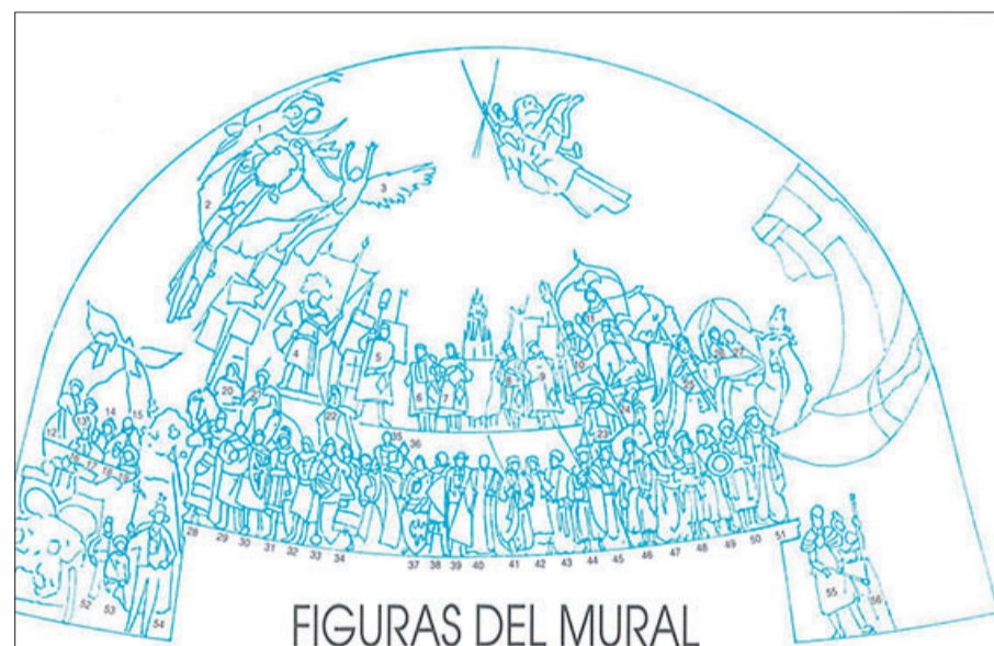
FIGURAS DEL MURAL DE LA FESTA